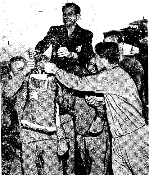
Emil Zatopek najpopularniejszy uczestnik Igrzysk Olimpijskich na rękach swoich rodzaków

BRATYSŁAWA 3.8 (tel. wł.). Mecz piłkarski Honved — UDA (odpowiednik naszego CWKS) zakończył się nikłym zwycięstwem piłkarzy węgierskich 2:1 (1:1).