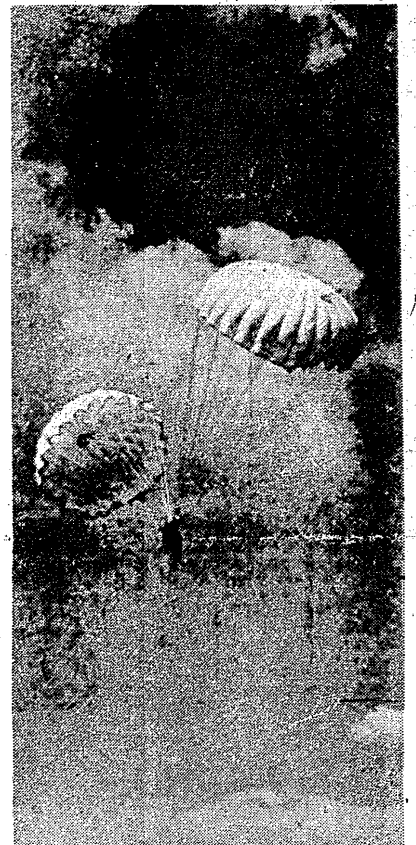
W Warszawie rozpoczęły się Krajowe Zawody Szpadochronowe — patrz sprawozdanie na str. 3

Wyżej wymienieni swymi osiągnięciami i wynikami oraz wpływem wychowawczym na młodzież uprawiającą sport — szczególnie przyczynili się do podniesienia ogólnego poziomu sportu polskiego i do jego sukcesów w spotkaniach międzynarodowych.