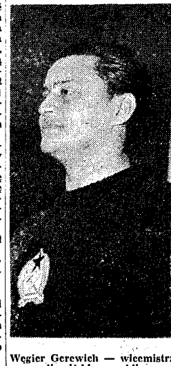
Węgier Gerewich — wicemistrz olimpijski w szabli.