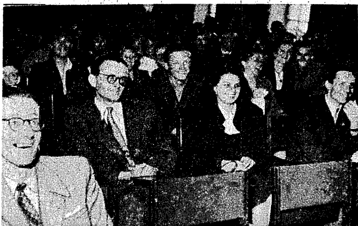
— O właśnie jest tu jeden korespondent, który chciałby... Sala trzęsie się od śmiechu i oklasków...