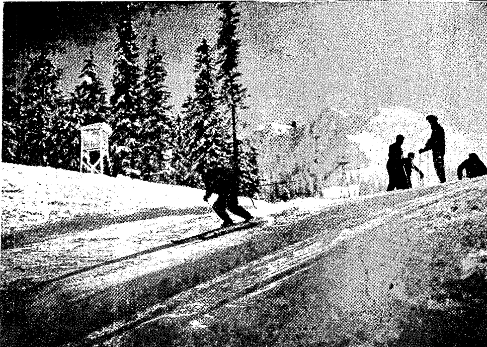
Na trasie biegu zjazdowego w Zakopanem.

SZERMIERKA. Walka na szable i bagnety stała na bardzo wysokim poziomie. Stawka zawodników była wyjątkowo żołnierska - sportowcy walczyli ambitnie, nieustępliście. Na podstawie wyników walk w szable i bagnety punktacją drużyny przedstawiła się następująco: