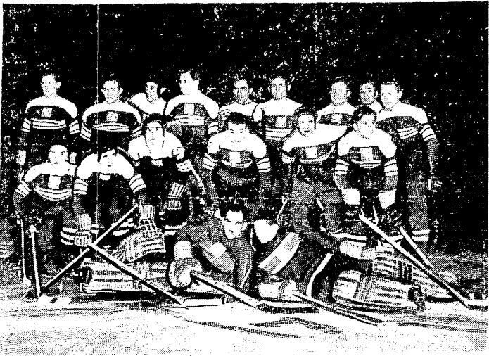
Hokejowa olimpijska reprezentacja Polski

Na lodowiskach Norwegii Polska - Szwajcaria 3:6 Z CSR przegrywamy 2:8, ze Szwecją 1:17