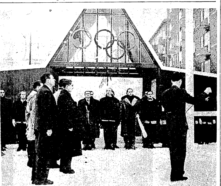
Podniesienie polskiej flagi w włosec „Ita” w Oslo