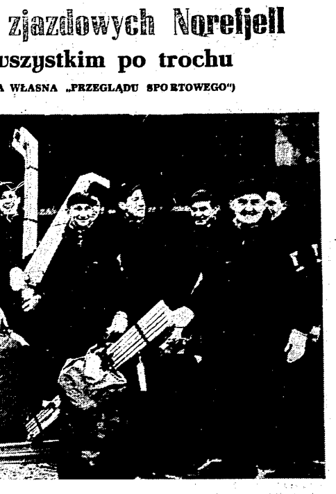
Reprezentanci Polski w hokeju przed dworcem w Oslo

— Coś się tak zagapił? — Teresa wzięła czekoladową bombkę i wolno odwijła srebrny paperek.