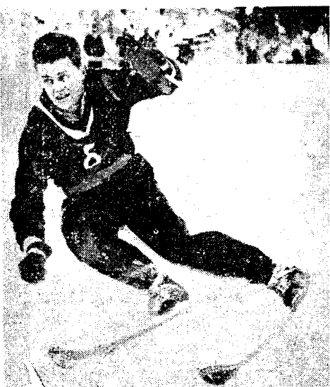
Norweg Sten Erikksen — zwycięzca slalomu gigantów na Igrzyskach w Oslo

400 m dow. 1) Procel (Kat.) — 5:16,0; 2) Kołczewski (W-wa) — 5:20,2; 3) Gładki (Kat.) — 5:39,2; 200 m grzbiet. 1) Lutomski (Poz.) — 2:45,5; 2) Sambalski (Kat.) — 2:47,5; 3) Zombek (W-wa) — 2:59,9; 4000 m dow. 1) Warszawa (Michalski, Kowalski, Prądo, Kołczewski) — 5:56,8; 2) Katowice (Mariński, Macha, Wiśniewski, Musiał) — 6:03,9; 3) Poznań (Marszałek, Kozłowski, Czapiński, Cichoński) — 6:10,9; 100 m dow. 1) Procel Kat. — 1:02,6; 2) Kołczewski W-wa — 1:03,3; 3) Prądo W-wa — 1:04,6; 100 m mot. 1) Cichoński W-wa — 1:14,4; 2) Kulski Kat. — 1:16,8; 3) Szoltysek W-wa — 1:17,8; 200 m zębki, 1) Kuklik Kat. — 3:39,5; 2) Górecki Pozn. — 3:51,8; 3) Nikodemski W-wa — 2:53,3; 4000 m zmiennej — 1) Warszawa — 4:52,2; 2) Katowice — 5:00,5; 3) Poznań — 5:18,4; Skoki do wody: 1) Brendler Kat. — 75,26; 2) Baklarz W-wa — 65,04; 3) Rekas W-wa — 63,99.