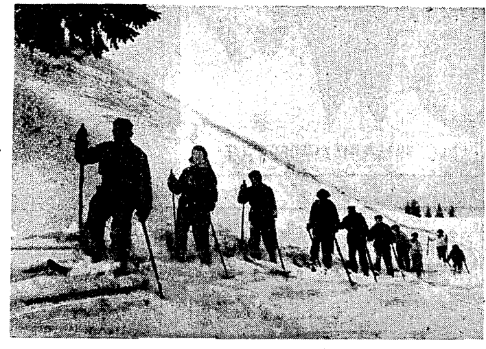
Grupa narciarzy na jednej z tras Raidu PTTK.