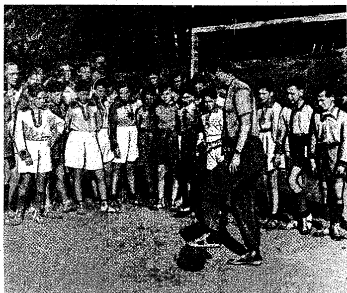
Cl zapaleny piłki nożnej z górnego zdjęcia — to symbol warunków w jakich młodzież robotniczych przedmieść, garnąc się do sportu, zmuszona była przed wojną zdobywać sprawność fizyczną...