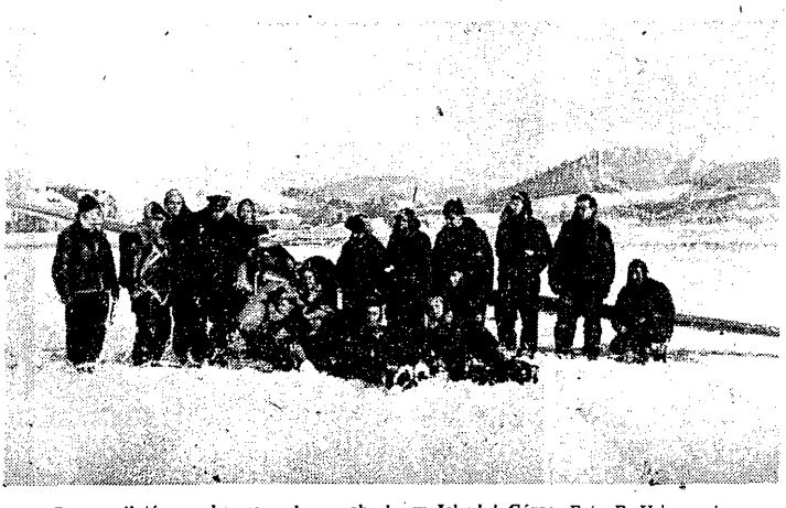
Grupa pilotów szybowcowych na obłokach w Jeleniej Górze.