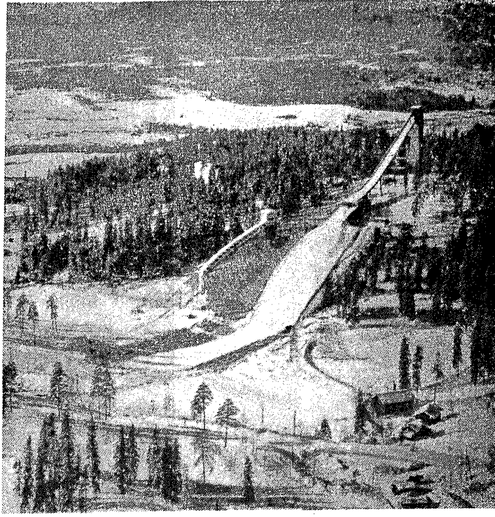
Widok na olimpijską skocznię narciarską w Holmenkollen.