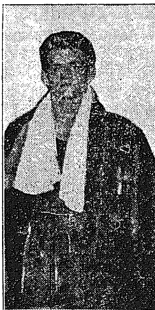
Naturalizowany we Francji Polak zdobył dla Europy 2-cenne punkty, bijąc swego amerykańskiego przeciwnika.