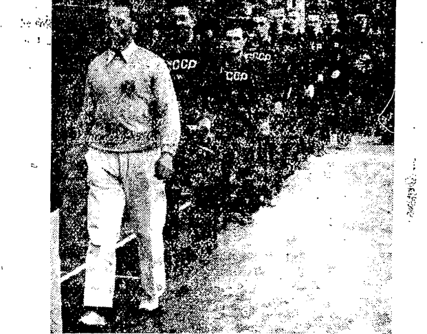
Prezentacja siatkarki moskiewskiego Dynamo przed meczem z AZS-Warszawa