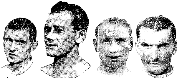
SKROMNY BARWIŃSKI PARPAN GRACZ