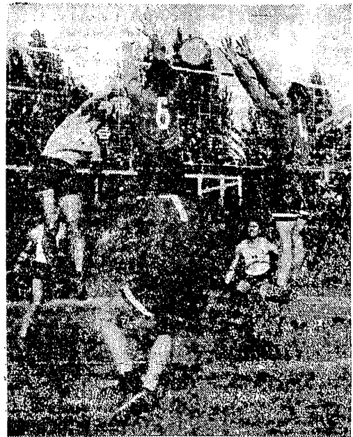
Szawinowi, oznacz. nr. 4 (Dynamo) nie udało się tym razem blokować (Sprawozdanie na str. 3)