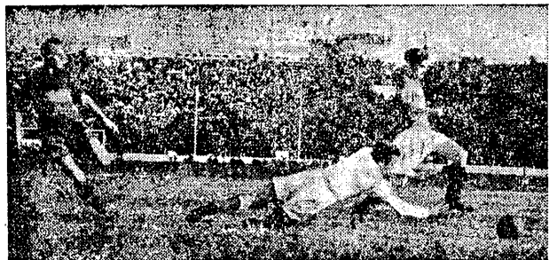
Fragm. z rozegranego ostatnio w Buku reszcie meczu międzypaństwowego między naszymi niedawanym (CSR) i przyszłym (Rumunia) przeciwnikiem. Czesi zdobyli drugą bramkę — interwencja Stanescu nie daje rezultatu