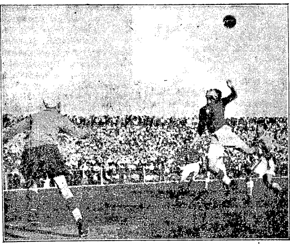
w czasie niedzielnego meczu o puchar Kaluży w Krakowie, Boracz w zrywającym podskoku oczekuje na rezultat pojedynku o górną piłkę między obrońcą Warszawą a napastą krakowską...