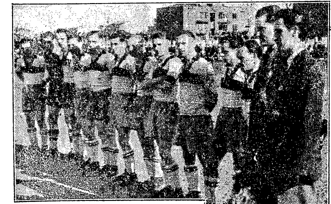
A. K. S. z Chorzowa doznał sensacyjną porażkę z Czacowią 1:6: