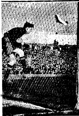
Biorąc w bramce był jasnym punktem naszej drużyny.