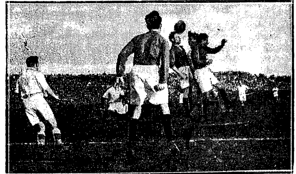
Pojedynek główkowy był z reguły zwycięstwie dla piłkarzy bułgarskich.