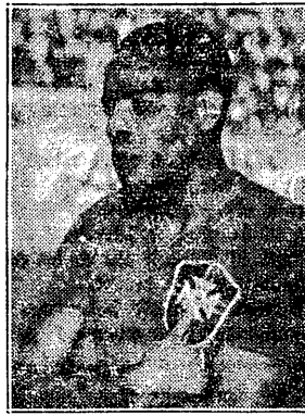
Domingo. Rio de Janeiro 6.IV.