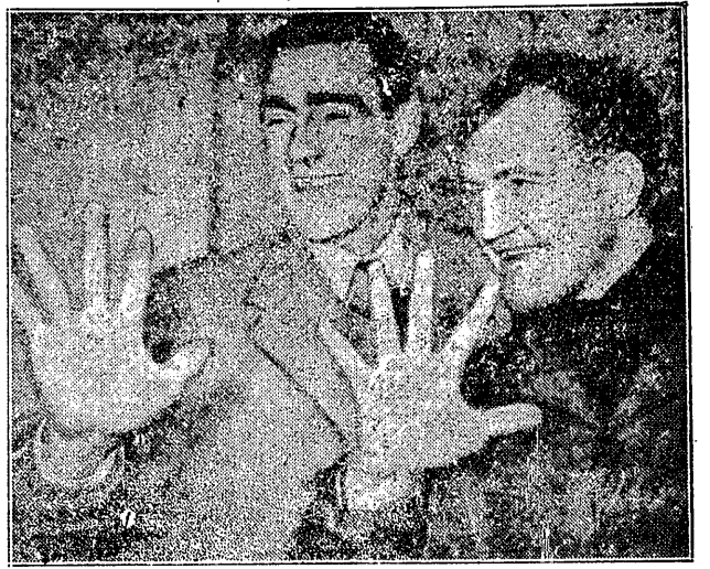
Świłt reprezentacyjny bramkarz W. Brytanii (z lewej) i amerykański bokser w ciężkiej wadze niedawny zwycięzca Woodcocka, demonstrując swe ręce, oddające im w swych występach nieocenione usługi.