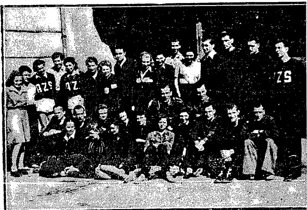
Grupa zawodników po treningu.

Przygotowania do męskich mistrzostw Europy w Pradze, można uważać właściwie za zakończone.