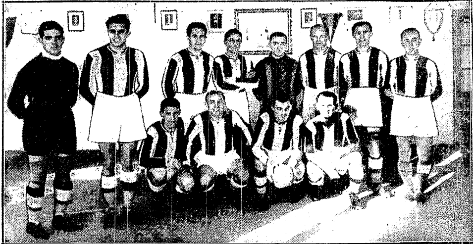
PILKARZE SZEGEDU z Szegedu nad Cisą przyjeżdżają na pięć meczów do Polski. Pierwszy mecz rozegrają z warszawską Polonią w niedzielę o godz. 17.30.