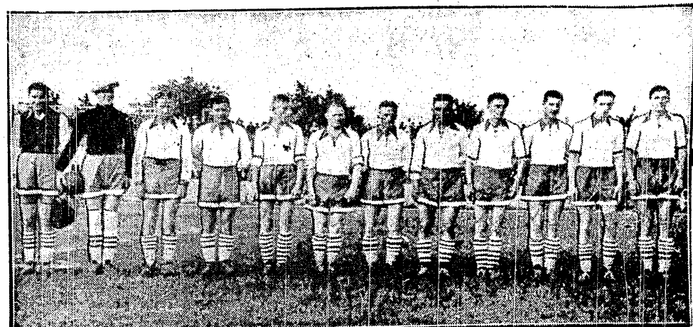
REPREZENTACJA PIŁKARSKA WILNA zwyciężyła Warszawę 2:1 i zakwalifikowała się do półfinału ze Stanisławowem.

Tony Galento krwawiąc stanął się na nogach. Kiedy od gongu dzieliło go