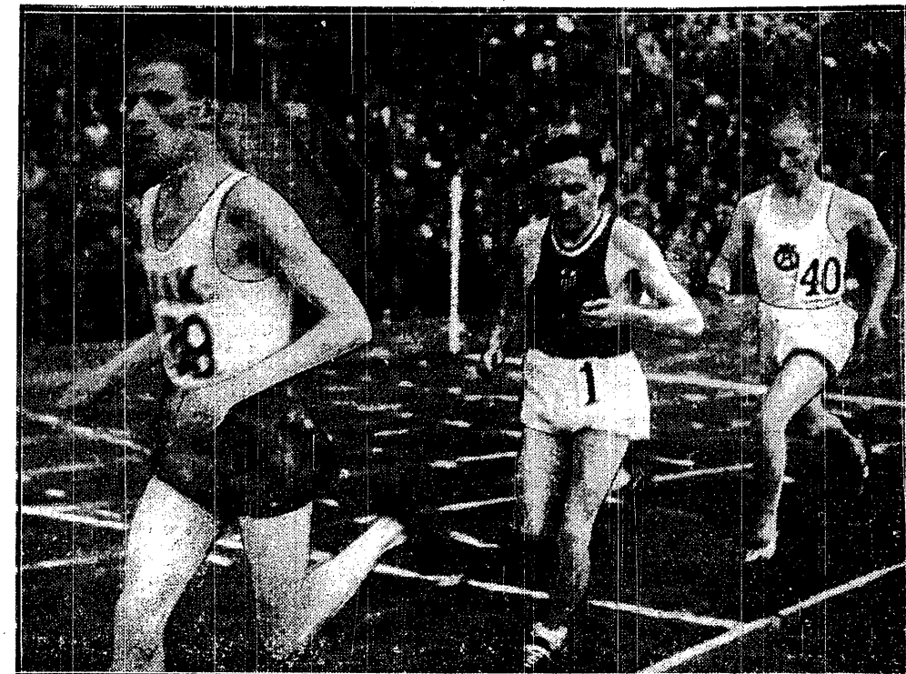
KUSOCIŃSKI NA STADIONIE W SZTOKHOLMIE bije nowy rekord Polski, osiągając czas 14:24,2 na 5 km. Zdjęcie przedstawia moment z tego biegu; prowadzi Szwed Tillman, Kusociński sprawdza tempo

Wyścig był tak wielki, że po minieciu celownika Targoński padł z wyczerpania. Już sama zwycięska walka Targońskiego z koalicją asów, stanowiła wielką sensację. Ale nie na tym koniec. Targoński zwyciężył w czasie, jakiego dotąd nie uzyskał jeszcze nigdy.