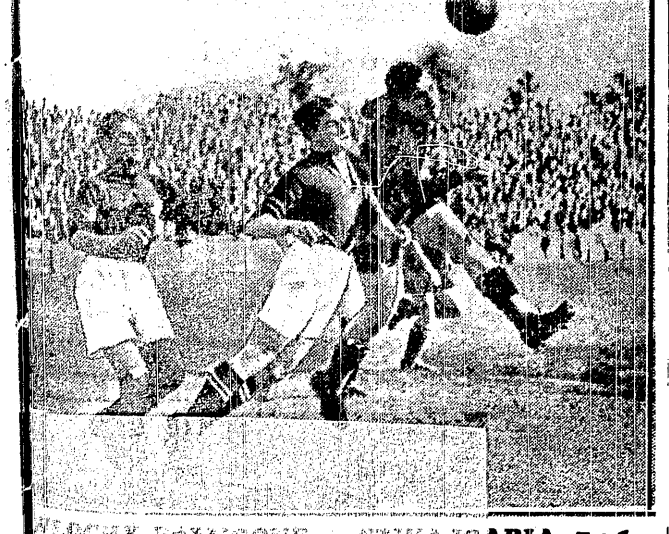
MECZY POKONANE — SZWAJCARIA 7:1