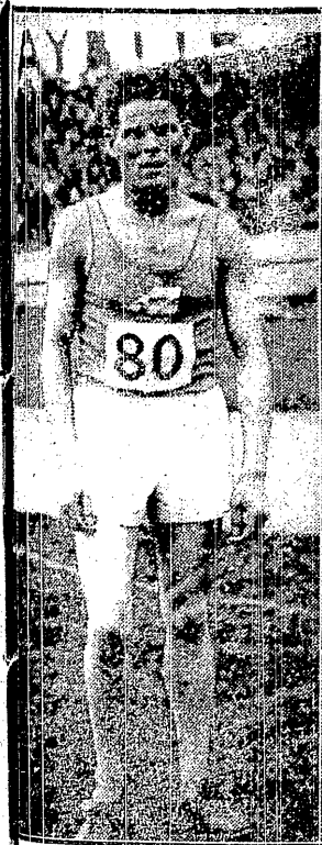
MAEKI rekordzista świata na 5 km.