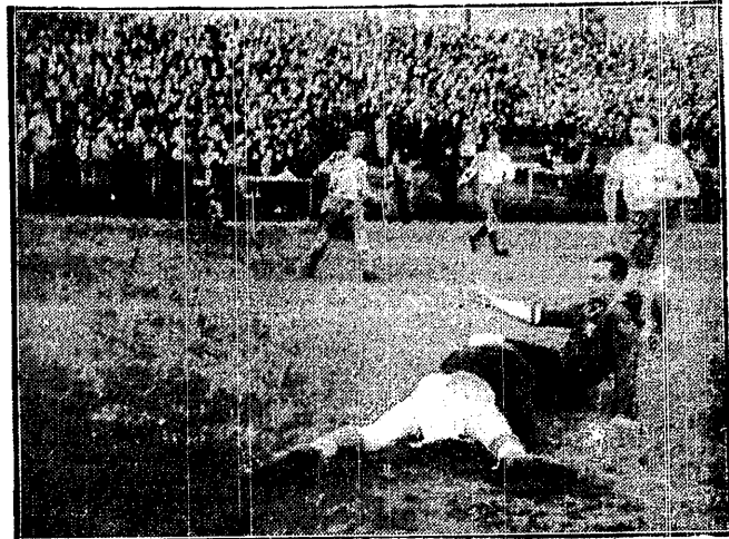
KRZYK UDAREMNIA AKCJĘ ISEMBORGHSA Z tytu Dytko, Wilimowski i Szczepaniak (Polska — Belgia 3:3)

ostatecznie wyłkani swym udolnością, że jest bezkonkurencyjnym wielobójcą Europy.