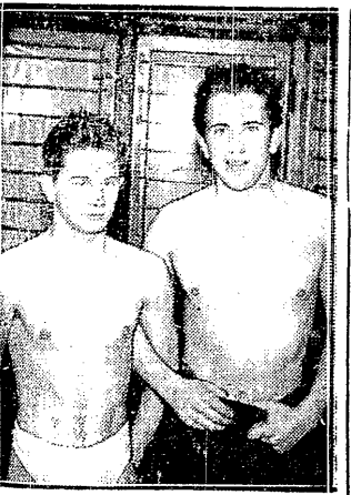
KUMMANT I LAMPELLE po wyścigu na 100 m grzb. wygranym po emocjonującej walce przez młodego Szweda.

Święta przyniosły nam 8 spotkań międzynarodowych. Bilans: 4 zwycięstwa, 4 przegrane, stosunek bramek 10:13 na naszą niekorzyść. W wykazie tym nie uwzględniamy naturalnie Gedanii, która nie jest dla nas przeciwnikiem zagranicznym.