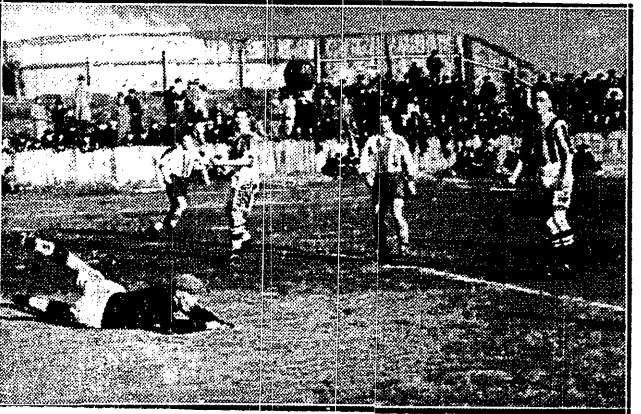
CO TO SIĘ DZIEJE? Bramkarz Warszawianki. Kondraci leży, a piłka mija go góra. Moment z meczu z Gedanią.