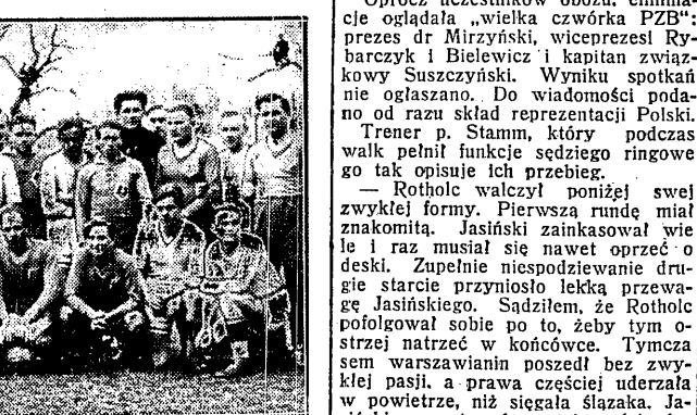
PIŁKARZE BRATISLAWY I POGONI przed pierwszym meczem, w którym Słowacy pokonali młodzież ligowców Lwowa (białe koszulki) 2 : 1.

POZNAŃ, 10.4. — Tel. wł. — Reprezentacja Polski na bokserskie mistrzostwa Europy została już wyznaczona. W pierwszy dzień Wielkiej Nocy odbyły się dwie walki eliminacyjne, które zdecydowały o obsadzie wagi muszej i koguciej.