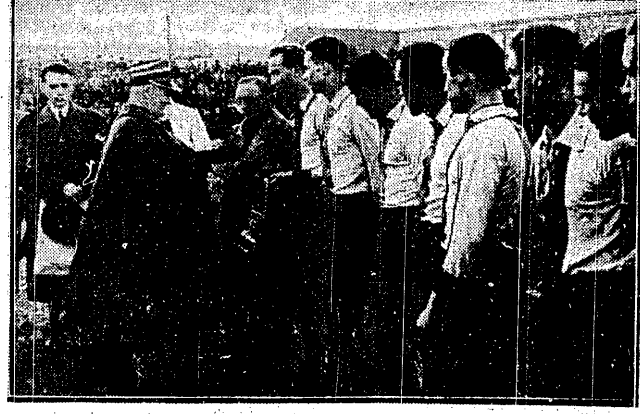
MJR. ROŻEK WITA PIŁKARZY GEDANII Przed meczem z Warszawianką, wiceprezes klubu stołecznego wręczył proporczyk kapitanowi gdzińszczan.