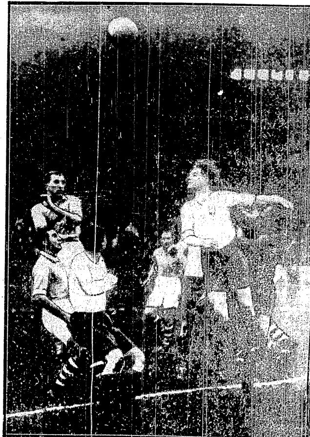
GŁÓWKA GÓRY UPREDZA