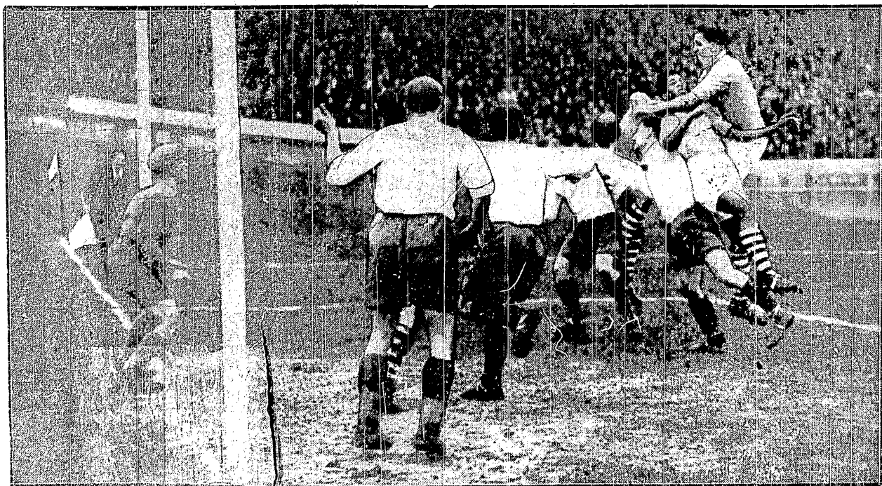
POD BRAMKĄ POLSKI WCIAŻ TŁOK

W zbytnim zapale Aston atakuje Ben Bareka