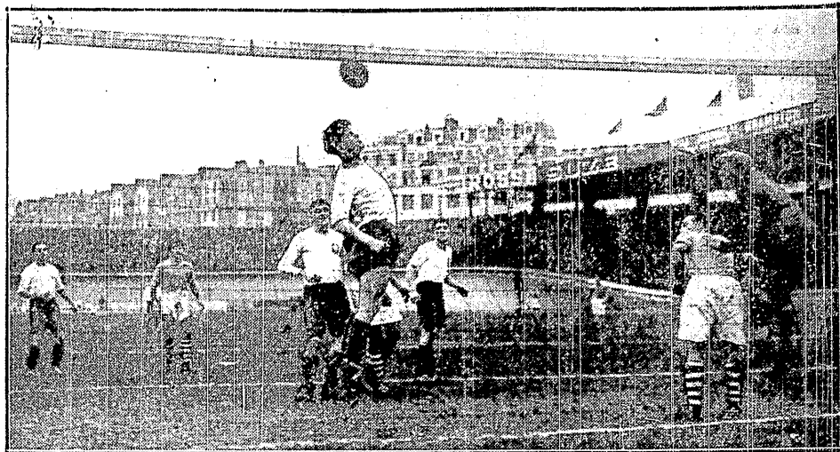
GŁÓWKA TWÓRZA OSTATNIĄ DESKĄ RATUNKU