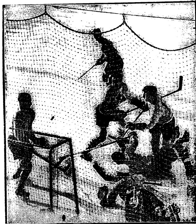
PRECZ Z KRAŻKIEM

Sytuacja jest groźna: bramkarz leży, obrońca go zastępuje. Chwila niezdecydowania i dwaj Kanadyjczycy zdobędą bramkę. Ale obrońca zdążył wybić krążek w pole.