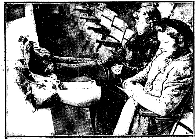
WYNALAZEK SZWEDZKI Dwie tyżwiarki ze Skandynawii przywiozły do Londynu wspólnie kapce futrzane, które wkładają na buty z tyżwami. Nogi nie marzną, gdy przeciwniczki odrabiają długie i nudny program obowiązkowy

kabi, w piątek 29 bm. Legia - O. M. W sobotę rozlosowana będzie kampania mistrzowska, która rozpocznie się zaraz po Nowym Roku.