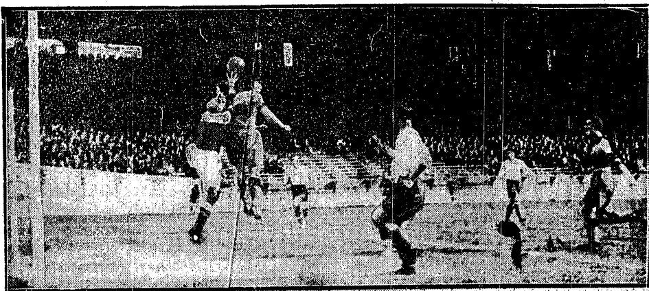
GDY BIŁO SIĘ LIGĘ PARYŻA 5:1

u w Zakopanem zdetronizować mistrzów świata. Herber, Baier