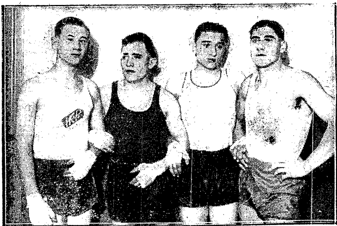
PRZYSELE FILARY ŁODZI

zurek przyszedł do nas dopiero w 4 miesiące później, Pazurek II wstąpił do nas w roku 1934, a Malik w ogóle u nas nie grał. Wobec tego, jak widać, zarzuty wszystkie, podobnie jak i poprzednie, wyszane są z palca. My z tego wyciągnęliśmy odpowiednie konsekwencje. Redakcje pism śląskich, prowadzące kampanie przeciw nam, pociągniemy do odpowiedzialności sądowej. Do odpowiedzialności pociągniemy również informatorów tej prasy, a ze względu na to, że zajmują oni pewne stanowiska w sporcie, zwróciliśmy się do odpowiednich władz z prośbą o zezwolenie na skargę sądową. Tylko przed krótkimi sądownymi rozliczamy się z tymi wszystkimi panami, którzy przegrawszy kampanie na innym podwórku, rzucają pod naszym adresem niecne kalumnie