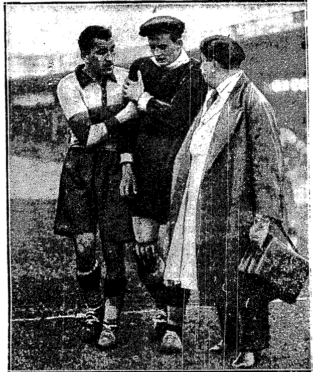
NIE CHCĘ WIĘCEJ ZNAĆ WĘGRÓW —

Przeglądu Sportowego inż. Jerzy Grabowski