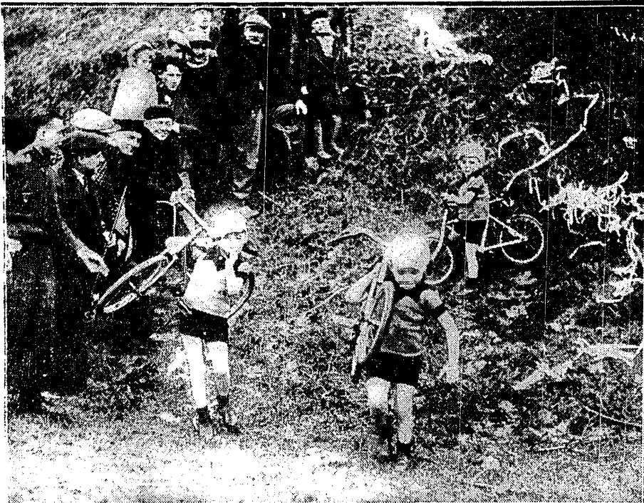
CHŁOPCY RUMUŃCY JESZCZE W LISTOPADZIE — NA TRASIE