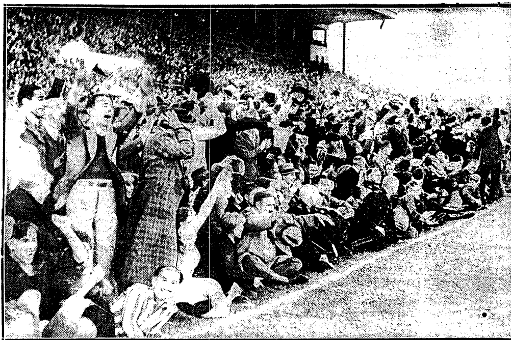
STADJON W. P. WIWATUJE PO ZDOBYCIU BRAMKI PRZEZ POLAKÓW

1500 mtr.: Igloi i Simon biegają w granicach 4 minut. Tu najbardziej odczuwamy brak Szabo.