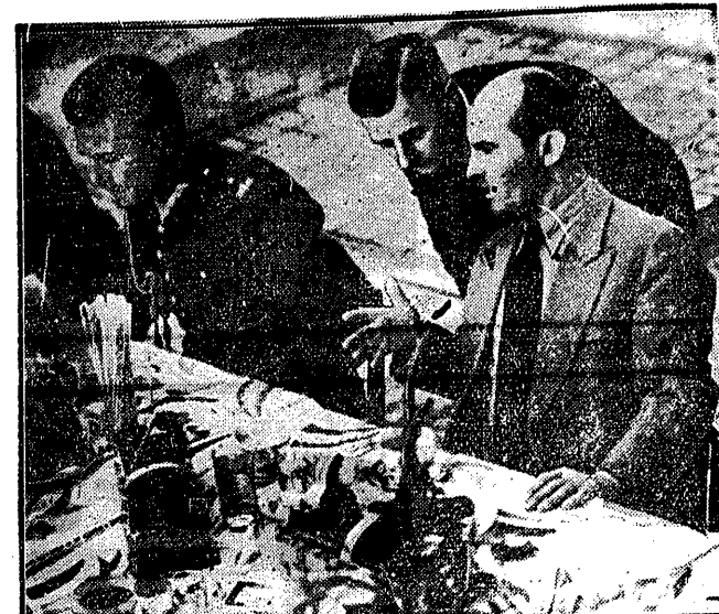
KRÓL TENORÓW, JAN KIEPURA W YACHT-KLUBIE Zapewne tematem rozmów był tym razem sport.