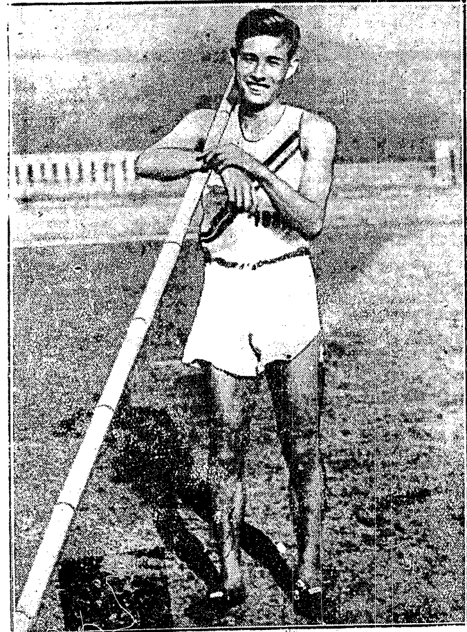
PAN OYE MOŻE SIĘ CIĘSZYĆ! Przed chwila ustanowił rekord Japonii w skoku o tyczce 4,34 m. i wraz z rodakiem swym Nishida ubiegać się będzie o medal olimpijski!

Najbliższy (46-ty) numer PRZEGLĄDU SPORTOWEGO ukaże się w znacznie powiększonej objętości we wtorek dn. 2-go czerwca