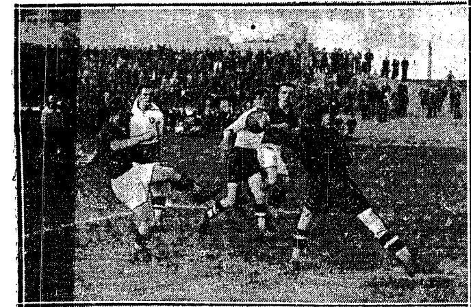
ZWOLNA PANOWIE, JESZCZE JA TU JESTEM! Złodek w porę wyskoczył, by unieszkodliwić strzał Lewandowskiego na meczu Garbarnia — ŁKS 3:1.

Puchar Davisa AUSTRIA — POLSKA 2:2 Metaxa—Hebda 4:6, 5:7, 4:6 Baworowski—Tłoczyński 6:4, 6:3, 6:4 Metaxa, Baworowski — Hebda, Tarłowski 6:2, 6:1, 6:4 Baworowski—Hebda 0:6, 6:2, 6:4, 1:6, 1:2 (przerwany)