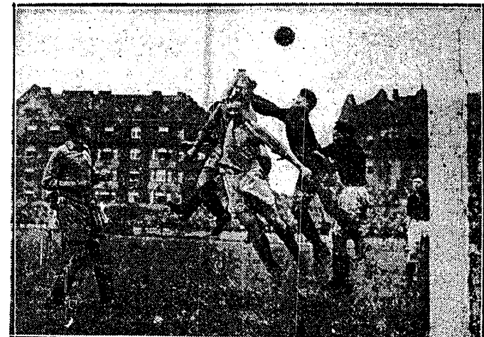
ANGIELSKI OBRAZEK — NA PRASKIM BOISKU. Trzech ich skoczyło wspaniale do piłki, ale żaden nie dał rady, Planiczce. Emocjonujący fragment z meczu Liverpool—Kombina wana Sparta i Slavia 4:2.