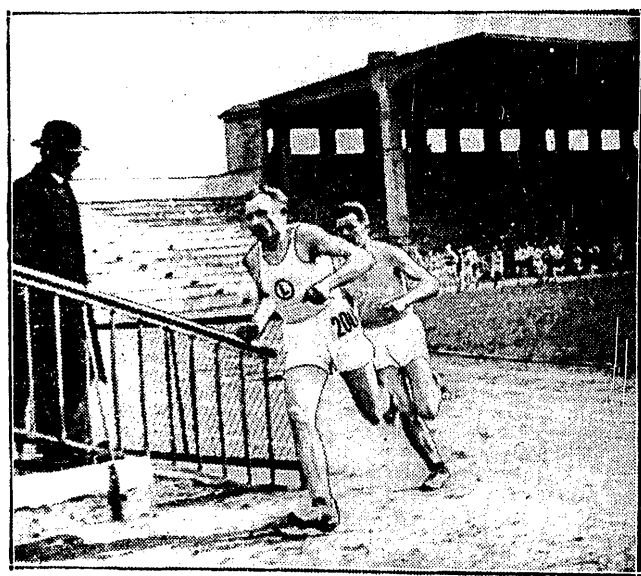
NOJI (LEGJA) I JANOWSKI (WARTA) wyprzedzili znacznie całą stawkę uczestników biegu naprzelaj Kurjera Poznańskiego