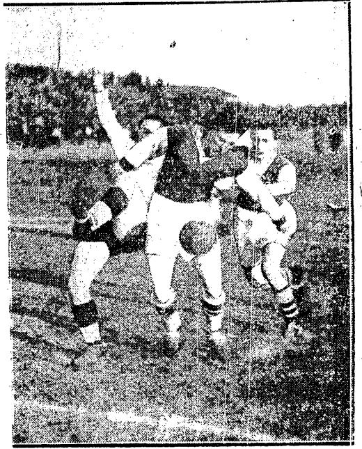
WALKA WRĘCZ na przedpolu Ł. K. S. podczas meczu z Warszawianką 1:1 w Łodzi