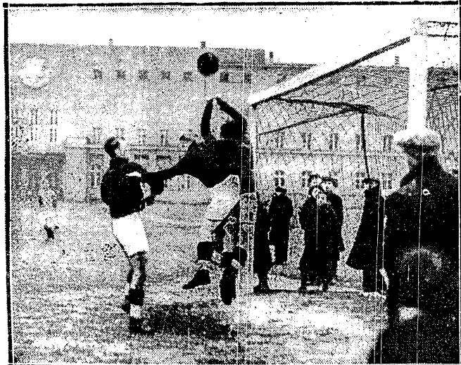
A. Z. S. — LEGJA 2:1