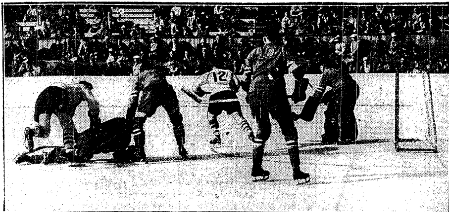
NAJSCIE KANADYJCZYKÓW NA BRAMKĘ U.S.A podczas olimpijskiego meczu finałowego 1:0.