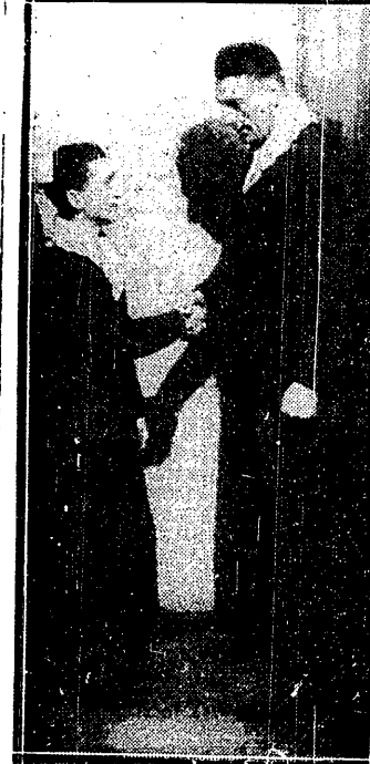
SOBKOWIAK I PIŁAT stanowią normalne granice (mucha i ciężka), w których mieści się mistrzowski zespół Warty.