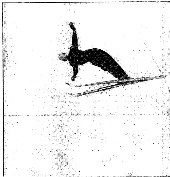
BIRGER RUUD PŁYNIE W POWIETRZU po złoty medal olimpijski.

Bo przecież nic nie łatwiej w tym wypadku jak o rewanz. A przecież każdy przyzna, że gdyby za rok Liga w rewanzie złożyła wnioski o zniesienie