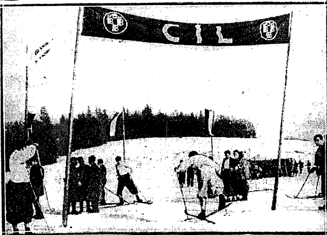
IGRZYSKA MAKABIADY W BAŃSKIEJ BYSTRZYCY Meta biegu 4x10 km., którą mijają właśnie zwycięzcy narciarzy osady C. S. R.