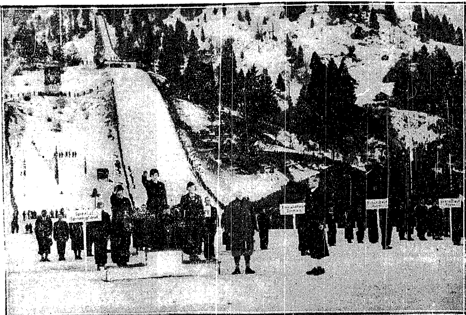
FANFARY OLIMPIJSKIE WITAJĄ ZWYCIĘZCÓW Na podwyższeniach stoją triumfatorzy kombinacji alpejskiej: Christl Cranz (Niemcy), Käthe Grasser (Niemcy) i Schon Nilsen (Norwegia).