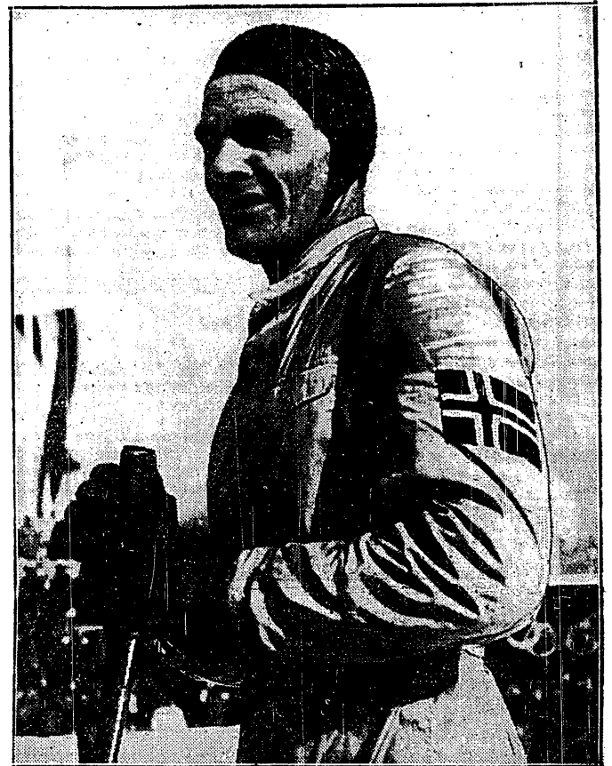
MISTRZ KOMBINACJI ODBJORN HAGEN powtórzył sukces swych rodaków z Chamonix, St. Moritz i Lake Placid, zdobywając dla Norwegii złoty medal olimpijski w najważniejszej konkurencji narciarskiej.

Do rozegrania pozostały jeszcze konkurencje następujące: jazda figurowa pan i panów, hokej, oraz z konkurencji narciarskich — bieg na 50 km. i skoki otwarte.