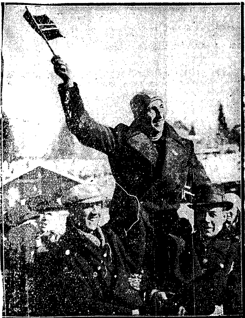
PO TRIUMFIE w biegu łyżwiarskim na 500 mtr. Norweg Ballangrud wędruje na barkach swych ziomeków.