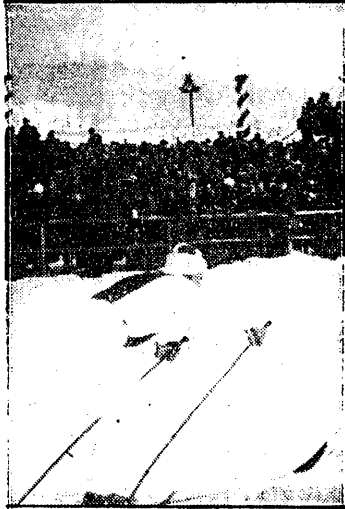
LARSSON zwycięzca 18-ki dobiega do mety