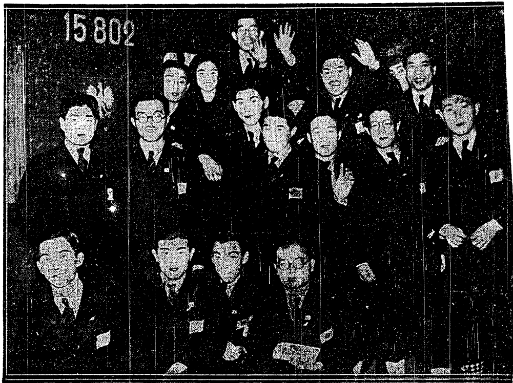
EKSPEDYCJA OLIMPIJSKA JAPONJI PRZEJAZDEM PRZEZ WARSZAWĘ Cześć gości zamorskich zatrzymała się w Polsce na dwa mecze hokejowe, a reszta pojechała do Garmisch, odrazu.