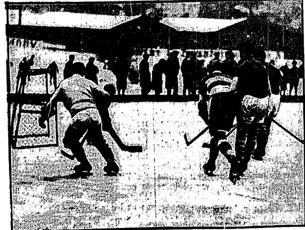
A. Z. S. — WARSZAWIANKA 6:0. Zamiast swych kolegów z Poznania, akademicy pokonali w hokeju młody zespół Warszawianki.