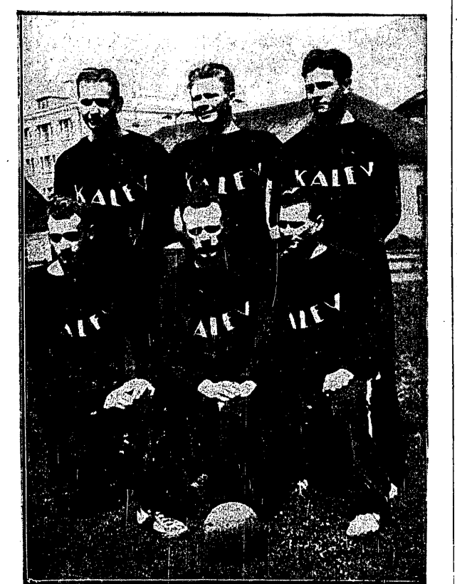
KOSZYKARZE ESTONSCY z klubu Kalev, mającego swą siedzibę w stolicy Estonii, Tallinie, przybyła do Warszawy, gdzie rozegrają mecze z AZS-em i Polonią.