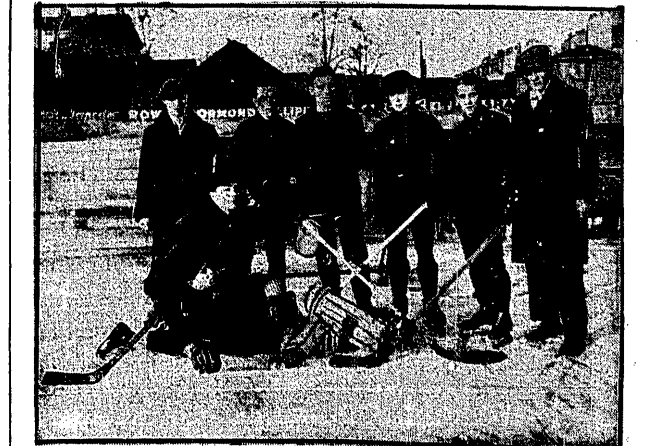
ZESPÓŁ HOKEJOWY SKRY należy do najmłodszych drużyn stolicy. W niedziele zwyciężyli on drużyna Z.A.S.S. 3:1.