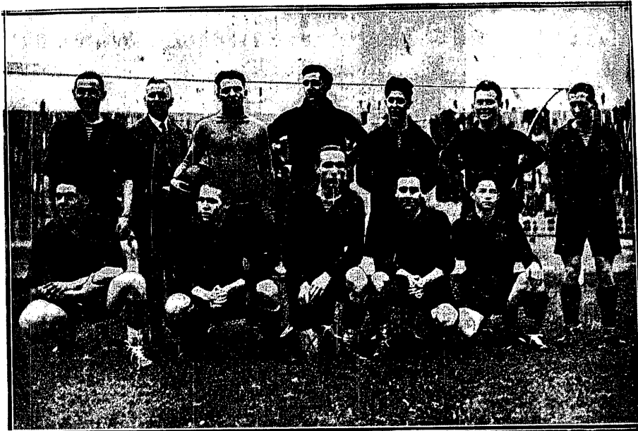
Ostatnie zdjęcie dwu drużyn przed meczem w Brukseli, gdzie goście szwajcarscy uzyskali zaszczytny wynik 1:2, który rehabilituje ich nieco po klęsce z Austrią 1:8.