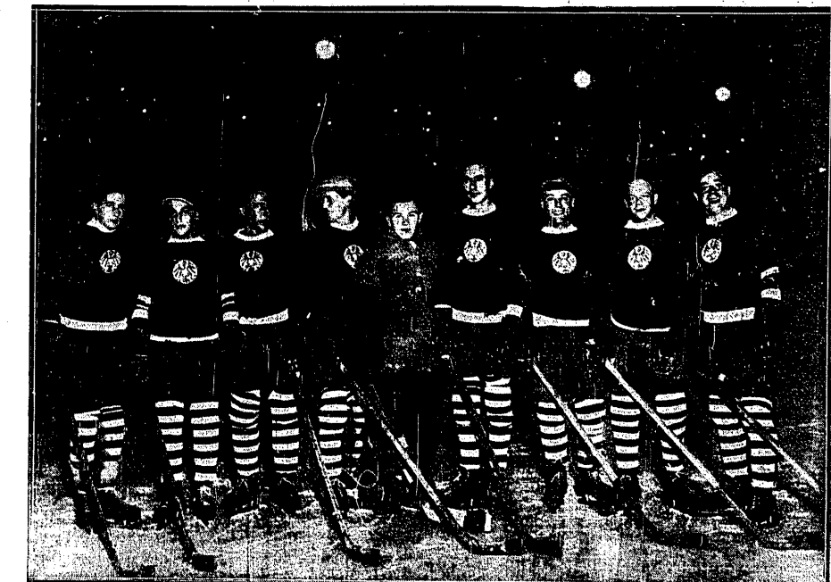
MISTRZOWIE EUROPY Zespół Wiener Eislauf Verein, zdobywca tytułu najlepszego zespołu Europy w zeszłorocznym turnieju „krynickim”, pokonał ostatnio w Wiedniu „Warszawę” 2:0.