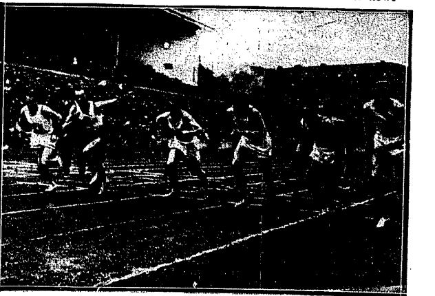
WIELKIE ZAWODY W MONACHIUM Start biegu 800 mtr., wygranego przez dr. Peltzera...

to idealne połączenie wzmacniającego nerwy cukru i odżywcem k a k a o.