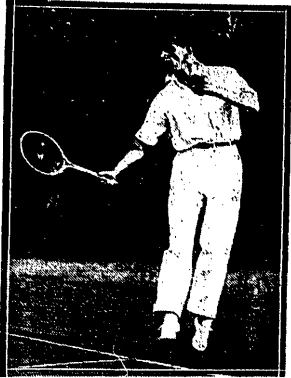
weteran tenisu hiszpańskiego, świeci ciągle jeszcze triumfy.