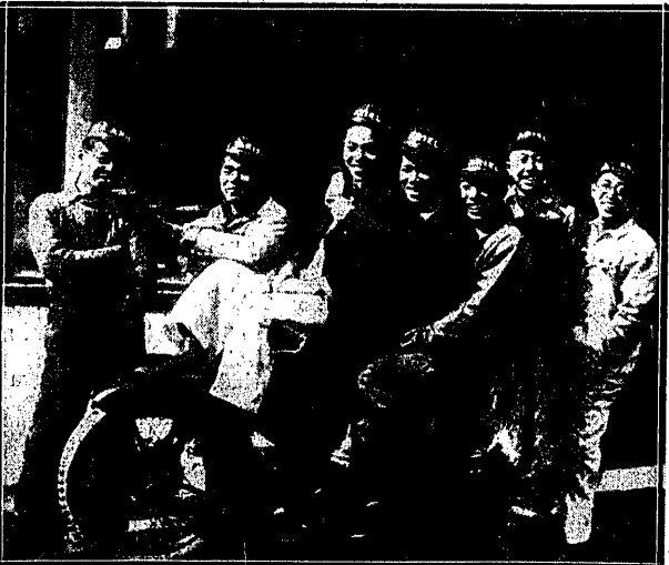
JAPONSCY MOTOCYKLIŚCI przed gmachem reprezentacji Ariela w Tokio.