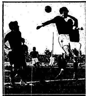
POLONIA — CZARNI 5:0.

Dlatego też, ciesząc się szczerze ze zwycięstwa w Oslo, nie