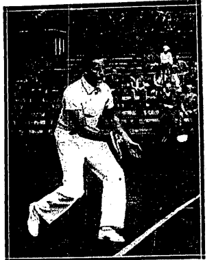
wybija się na czoło graczy Europy, choć przegrał z Prennem.