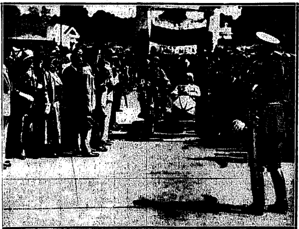
START RAIDU MOTOCYKLOWEGO. który wyruszył dn. 17 b. m. z Łobzowianki w Warszawie.