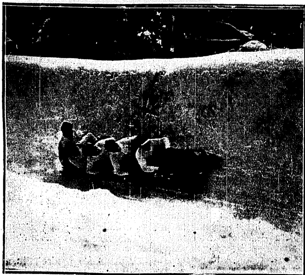
TOR BOBSLEJOWY W GÓRACH HARCU.

którzy uzyskali ostatnio dwa piękne wyniki w Katowicach: z komb. Legia 2:2 i Pogonią 1:2