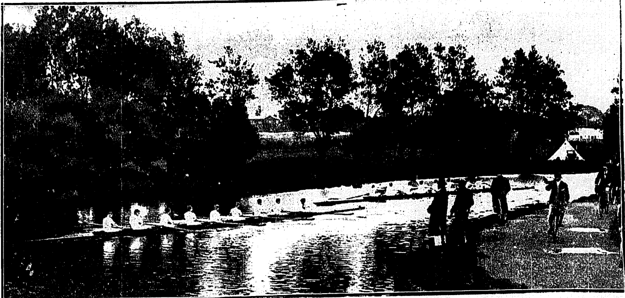
TRENING STUDENCKICH OSAD WIOŚLARSKICH NA WODACH ANGLII