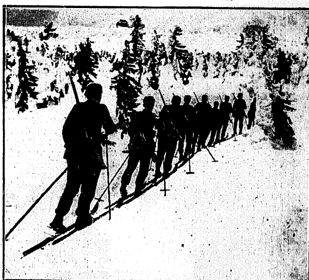
WOJSKOWE ĆWICZENIA NARCIARSKIE

Effektowny moment brania największej krzywizny przez osadę niemieckiego „boba”, który trenuje przed międzynarodowymi zawodami