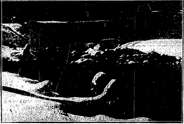
W DRÓDZE DO KUZNIC Słabe przyswarzki nie zdolają jeszcze zapoczątkować nad notocznikiem górskim