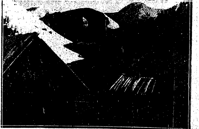
DOLINA JAWORZYŃKA atulona w puchach pierwszego śniegu zimowego.