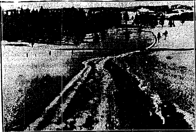
PIEWSZY ŚLAD Płytki jeszcze koleina narciarska na Antolówce.