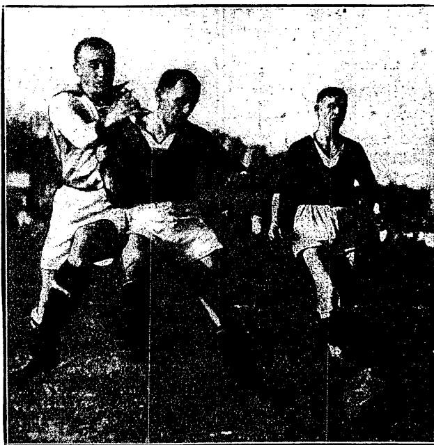
GARBARNIA L. K. S. 2:0 Pazurek mija świętego obrońcę L. K. S.—Cylla po walce i strzela pierwszą bramkę.