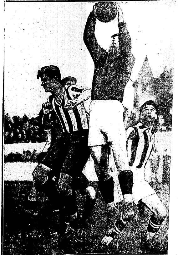
CRACOVIA — SPORTKLUB (Wiedeń) 4:1.

Sprzedż biletów na miejscu. Szczegóły w afiszach.