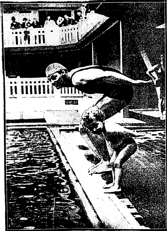
WEISSMUELLER I JEGO „GROŹNY” RYWAL

Słynny pływak bawi się w basenie z 5-letnim malcem, któremu przepowiedział wielką przyszłość.