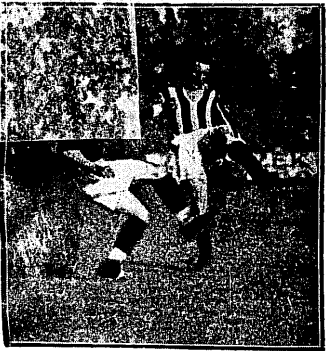
CRACOVIA — WISLA 2:1 Poedynek dwu mistrzów techniki: Sperlinga i Kotlarczyka II.

Mimo: Loti, zdając sobie sprawę z odpowiedzialności, jaka na