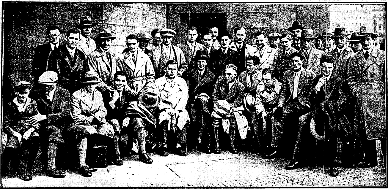
REPREZENTACJA WARSZAWY NA DWORCU W LIPSKU

Powinny rozbudzić chęć rewanżu, powinny być załączkiem regeneracji ducha zwycięstw. Chcemy słysać w świecie nie z klęsk, lecz ze zwycięstw. Chcemy by nasz sport pomnażał poczucie sił naszych, a nie obcych.