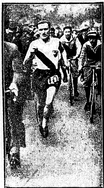
JANUSZ KUSOCIŃSKI nie niepokojony przez nikogo, dąży do mety.

Wioślarze poznańscy, zrzeszeni w Pozn. Kom. Tow. Wioślarskich otwarli w niedzielę uroczyste sezon. Gospodarzem była Polonia. Po podniesieniu bandery na maszt odbyła się defilada łodzi. Najokazalej wystąpił Tryton, który wystawił 23 załóg. K. Wioślarzki 04 przedstawił 10 załóg.