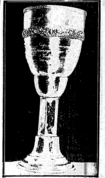
TROFEUM KUSOCIŃSKIEGO Puchar „Ilustrowanego Kurjera”, zdobyty przez świetnego crossmena.

W tym samym duchu piszą jeszcze inne gazety. Jak na tu-tejsze stosunki ocena gry jest bardzo pochlebna. (Lit.)