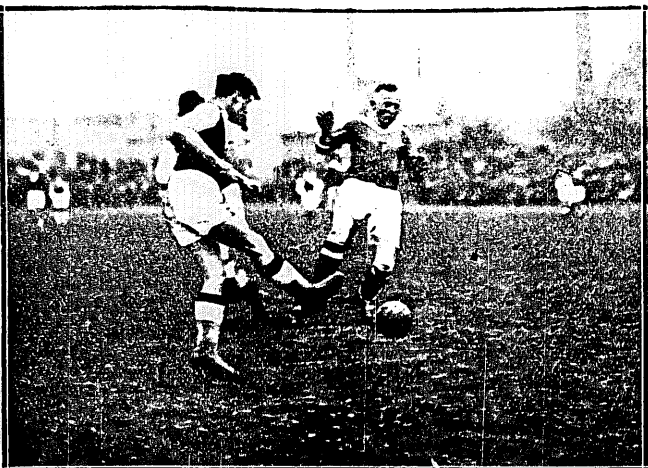
WARSZAWA — LIPSK 1:3

Napastnik Polonii nie umiał sprostać szybko i niezwykle ruchliwym obrońcom Lipska, którzy zawsze potrafili w porę interweniować. Z tyłu na lewo za Pazurkiem widzimy strzelca jednej bramki dla Polski — Malikę.