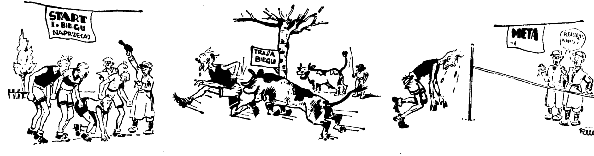
„Fotografie“ Kellera ze startu meły i trasv.