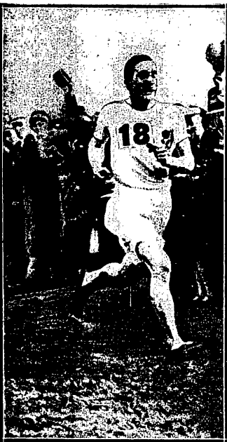
EVENSON (ANGLJA) przerywa taśmę, jako zwycięzca biegu naprzelaj siedmiu narodów.

Amerykianie nie mogą zrozumieć jak dr. Martin, cprawda