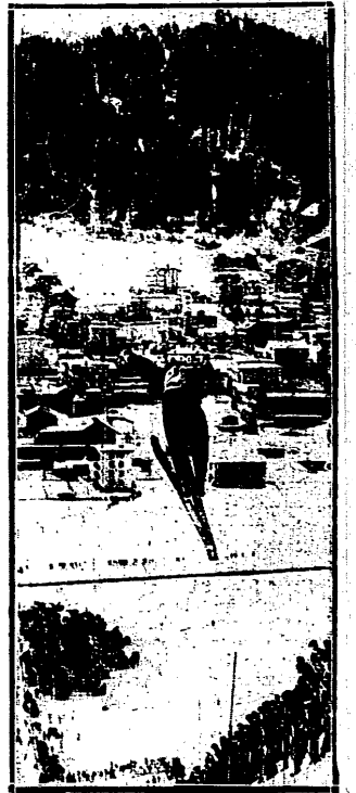
KAUFMANN Kroczek Szwajcarii, znajduje się ostro wino we wspaniałej formie.

W ten sposób na mistrzostwach w Krynicy byłyby reprezentowane trzy części świata: Europa, Ameryka, Azja.