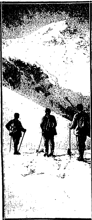
SZCZESLIWI SZWAJCARZY mają w górach dość śniegu, aby odbyć wycieczki narciarskie.