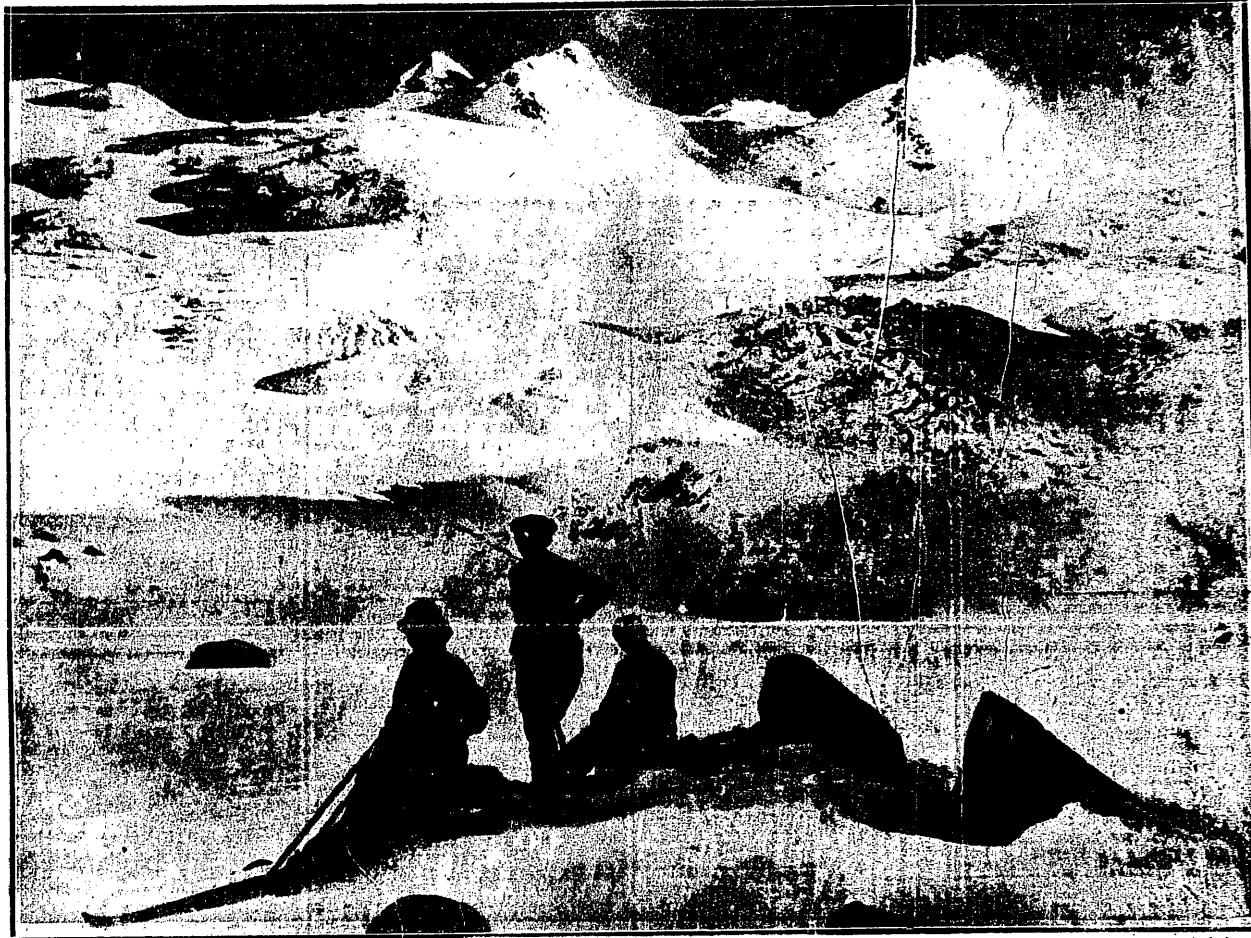
U KRESU WYCIECZKI WYSOKOGÓRSKIEJ.

Niestety, zmiana ta spowodowała wycofanie się z mistrzostw aż czterech państw: Anglii, Francji, Belgii i Węgier. Rzecz prosta nastąpi nowy podział, na dwie tym razem grupy (3 i 4 drużyny), a zwycięskie dwa państwa zetkną się w finale z Kanadą.