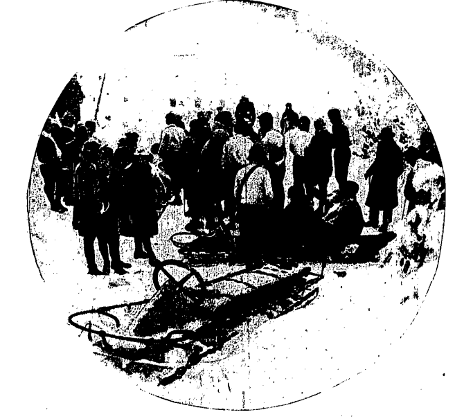
NA STARCIU BOBSLEJÓW Biorących udział w zawodach, rojno i gwarno. Jak wskazują kaski na głowach sportowców, przejazdka taka wymaga odwagi.