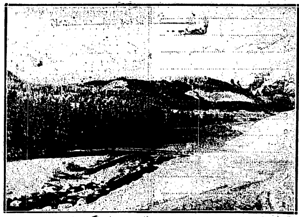
ZIMOWY KRAJOBRAZ PODGÓRSKI rozciąga przed okiem sportowca nieprzebrane pokusy terenowe dla uprawiania najrozmaitszego pod słońcem sportu — narciarstwa turystycznego, którego wspaniałe tradycje odżywiają w Polsce coraz bardziej.