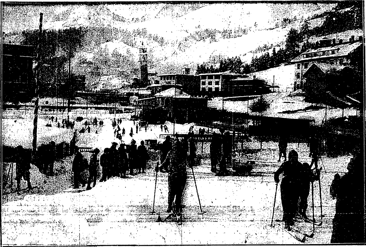
„ZIEMIA OBIECANA” SPORTOW ZIMOWYCH Ogólny widok St. Moritz z jego przepięknymi terenami narciarskimi i bajecznymi torami łyżwiarskimi i hokejowymi.