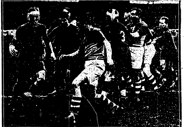
MECZ RUGBY O MISTRZOSTWO FRANCJI