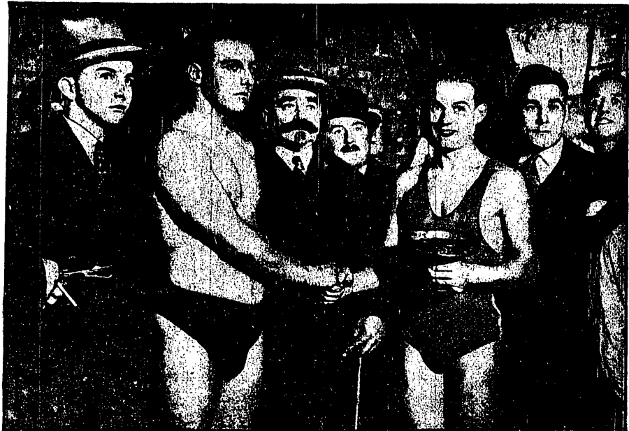
ZWYCIĘZCY ZAWODÓW WPLAW PRZEZ PARYŻ o których korespondencję zamieszczamy obok.