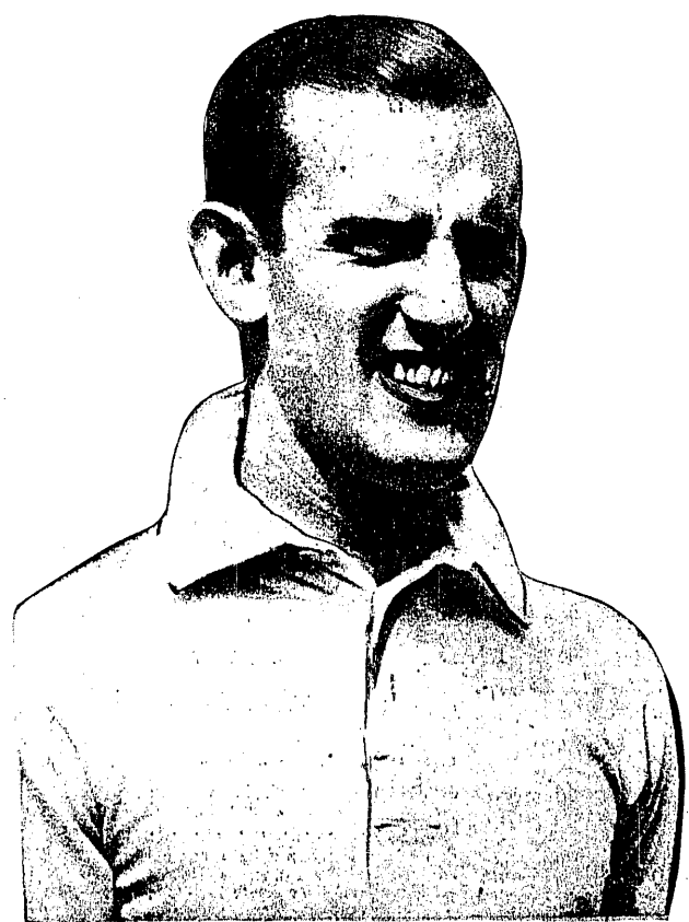
HANS MOLDENHAUER czołowy tenisista Niemiec i Europy zginął śmiercią tragiczną w Berlinie.

Na głośny wystrzał startera pływacy skoczą do wody. Widok wspaniały, 50 rąk brnie szare nurty, prawie wszyscy pływają, to też na początku startu odnośnie wrażenie jakby płynął jakiś potwór o 50-100 mackach.