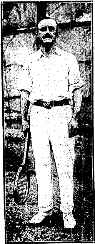
A. GORE (ANGLJA) światowej sławy tenisista zmarł nagle w Londynie.