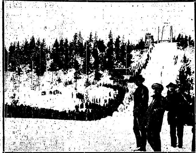
KRYNICA PRZED ZIMĄ