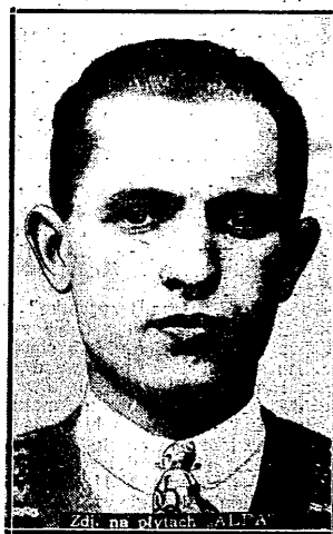
GŁOWACKI (Amatorski K. S.)

Kapitan Czechosłowackiego Zw. P. N., który udzielił „Prz. Sp.” interesującego wywiadu o turnieju, zapowiedzianym na 27 i 28 b. m. w Pradze (o czym piszemy obok).