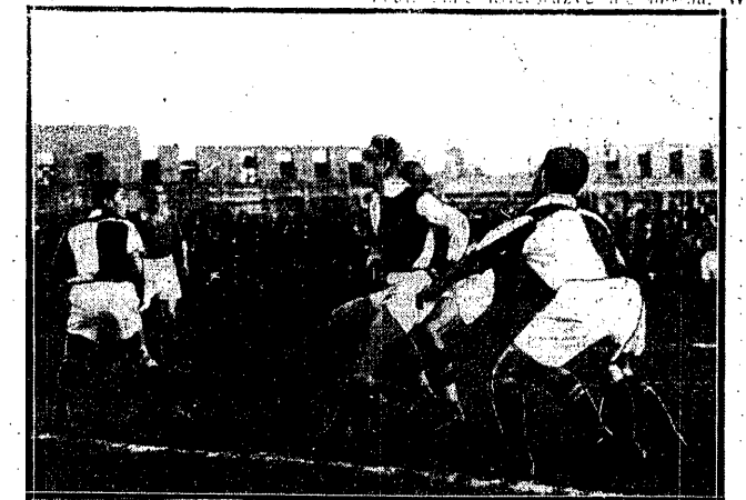
WARTA — WARSZAWIANKA 1:1

Czesi mają zamiar zasilić swój team amatorski w drugim dniu pięciu lub sześciu świeżymi graczami, czego my nie możemy użyć nie możemy. W