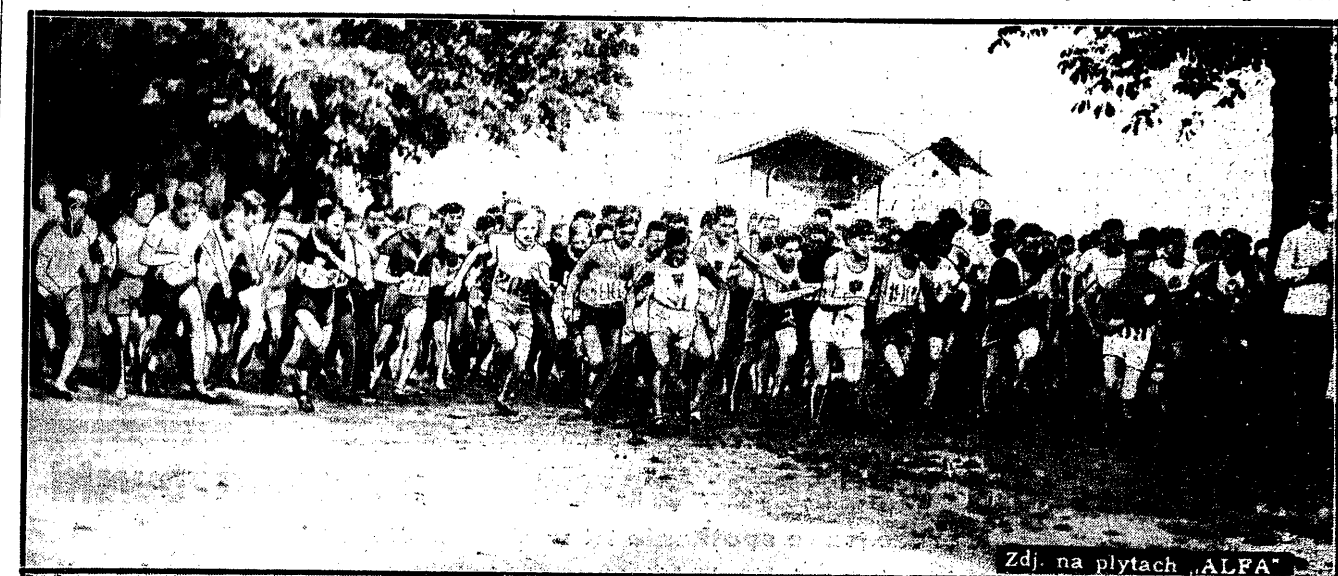
Zdj. na płytach „ALFA”