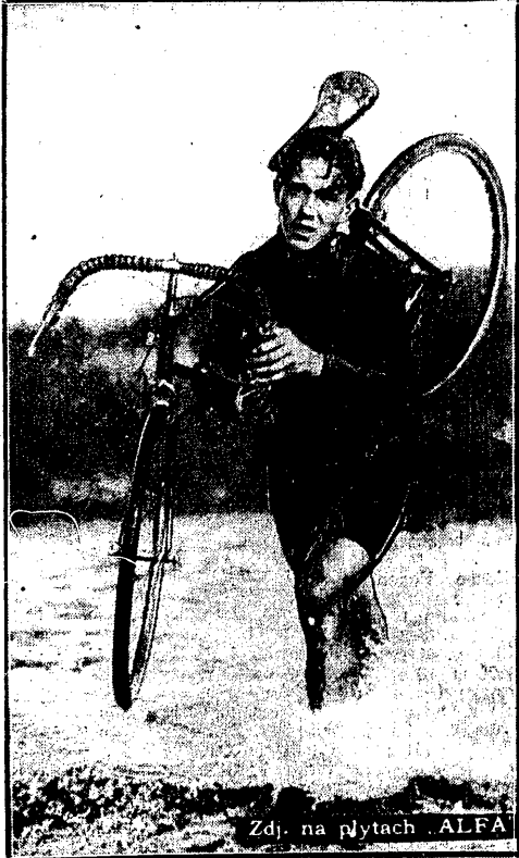
Zdj. na płytach ALFA

przez swe trzęcie z rzędu zwycięstw w kolarskim biegu naprzelaj zdobył mentował swą wyższość nad innymi rywalami w tej konkurencji.