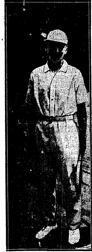
LACOSTE w opinii ogólnej pozostał nadal najlepszym tenisistą świata...