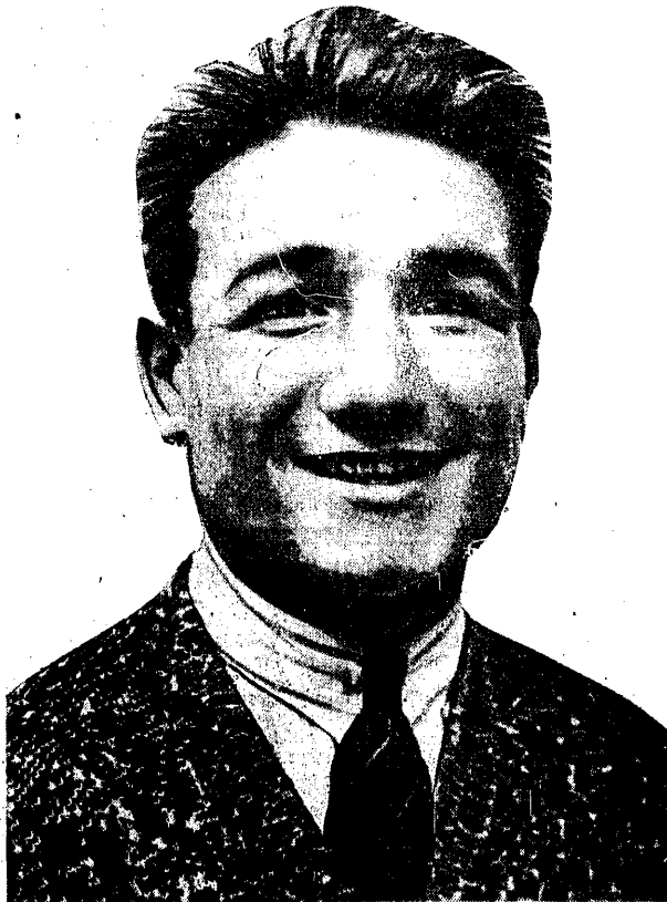
ANDRE ROUTIS bokserki mistrz świata wagi półciężkiej