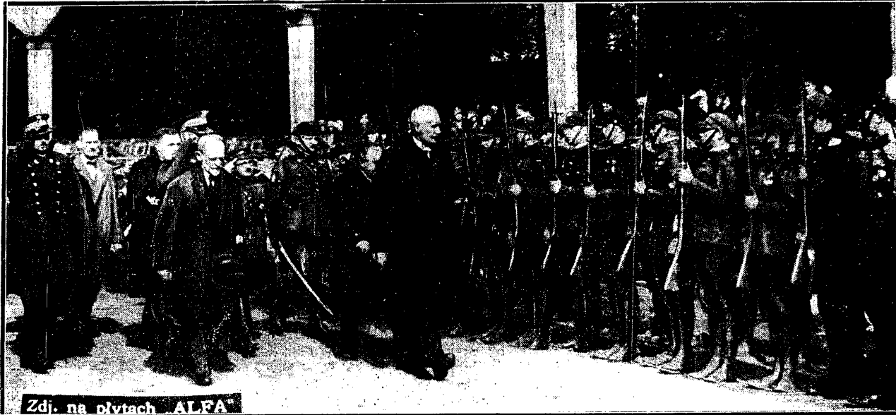
Zdj. na płytach ALFA

Jeden z najlepszych motaczy polskich, osiągnął 13.18 m. w rzucie kulą podczas meczu Kraków — Poznań, o którym piszemy na str. 2-giej.