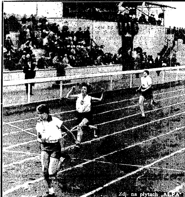
Zdj. na płytach ALFA