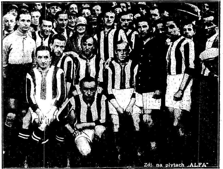
Zdj. na płytach ALFA