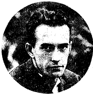
HENRYK COCHET najlepszy tenisista r. 1928