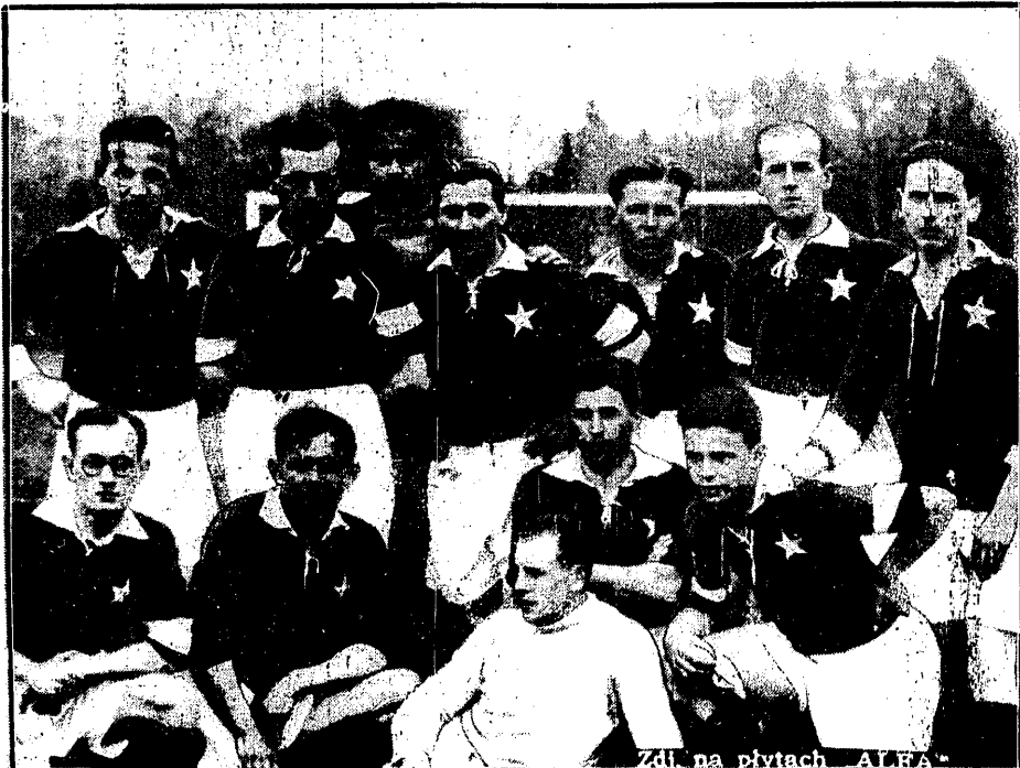
Zdj. na płytach ALFA

na meczu Kraków — Poznań zdobył pierwsze miejsce w 3-ch konkurencjach: 100 m., 200 m. i skoku wdal, przyczyniając się waleśnie do zwycięstwa Krakowa.