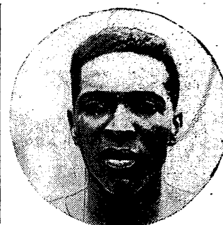
SYLVIO CATOR najlepszy skoczek świata