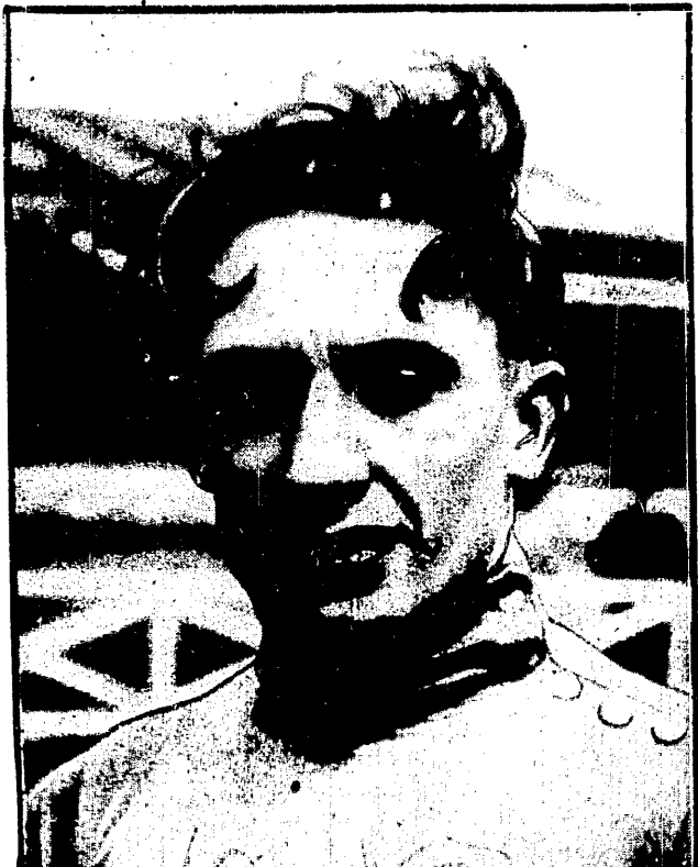
RONSE (BELGJA) zdobył mistrzostwo świata dla zawodników ze szpadzki w Budapeszcie.

W dalszym ciągu ten sam widok przewagi bez skutku, póki Warszawiance nie udało się wycisnąć piłki z bramkarza masowanego przez 2-3 pa ry nog. Pod koniec napór czarnych. Sędziował p. Marczewski.