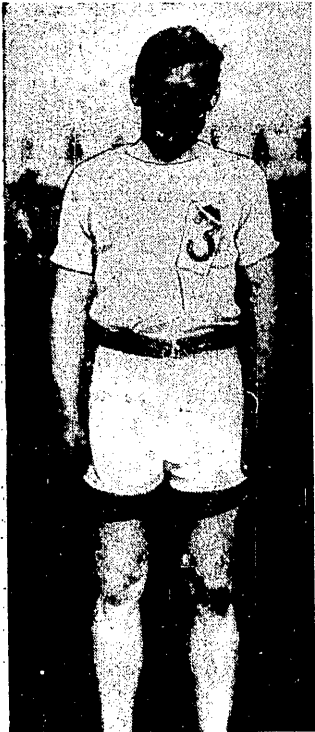
BURGHLEY (ANGLJA) podznaczony został przez związek Angielski nagrodą Hervey-Cup.