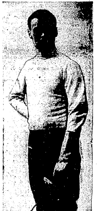
GAUDIN (FRANCJA) podwójny mistrz olimpijski w szpadzki i florecie.