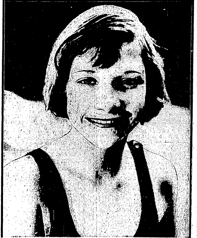
DORRIS PONTYON 13-letnia olimpijka, zdobyła mistrzostwo świata w skokach do wody.