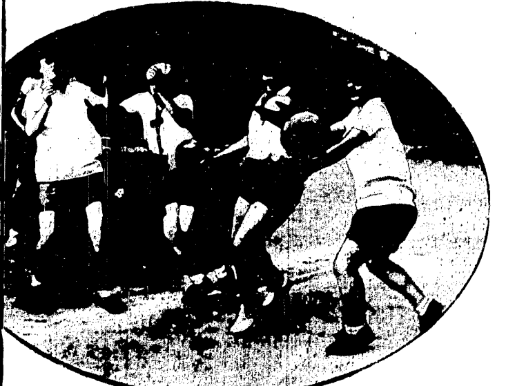
MISTRZOSTWA WARSZAWY W HAZENIE zostały zakończone zwycięstwem P.I.W.F-u przed Polonią i A.Z.S-em. Na zdjęciu ostatni mecz niedzielny Warszawianka — Sokół 9:0.