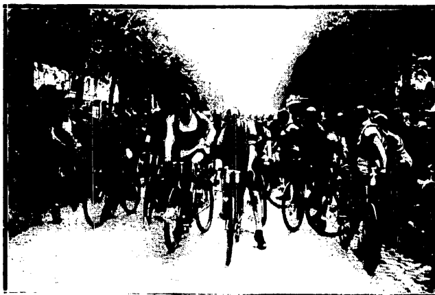
Start „Tour de France”.

Osemki. Bieg eliminacyjny przedolimpijski. Tor. 2400 mtr.: 1) A.Z.S. (Warsz.)